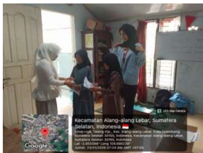
Gambar 4. Kegiatan Public Speaking

Hal ini sesuai dengan penelitian yang menyatakan bahwa latihan komunikasi sejak dini dapat meningkatkan kepercayaan diri dan kemampuan interaksi sosial anak. Selain itu, kegiatan kolaboratif juga memperkuat kemampuan kerja sama dan tanggung jawab sosial (Nuryeni and Zulminiati 2020).