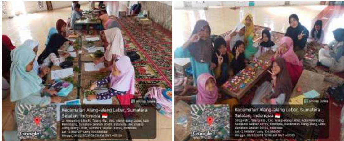
Gambar 3. TPA Ceria dan Kreatif

Selain itu, penggunaan metode kreatif dapat merangsang perkembangan kognitif dan emosional anak secara seimbang (Anggraeani and Rafiyanti 2022).