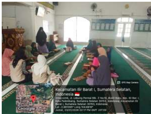
Gambar 5. Kegiatan Pendampingan Majelis Ta'lim

Penelitian menunjukkan bahwa manajemen kegiatan berbasis partisipasi masyarakat dapat meningkatkan efektivitas dan keberlanjutan program pengabdian.