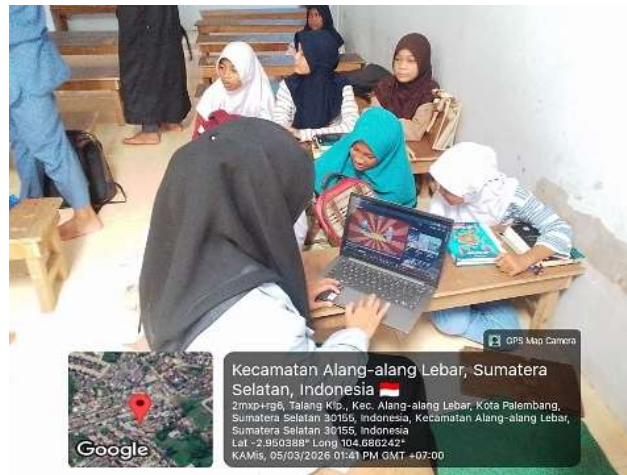
Gambar 6. Pendampingan Kegiatan Menonton Kisah Nabi

Penelitian menunjukkan bahwa literasi berbasis pengalaman dan media visual mampu meningkatkan daya ingat serta pemahaman anak terhadap materi pembelajaran (Fadila, et al. 2025).