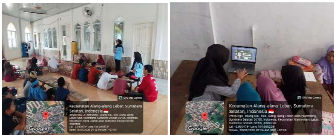
Gambar 2. Pendampingan TPA dan Sosialisasi Edukatif

Hasil ini sejalan dengan penelitian yang menyatakan bahwa pembinaan keagamaan yang dilakukan secara sistematis dan berkelanjutan dapat membentuk karakter religius anak serta meningkatkan pemahaman keislaman. Selain itu, pendidikan agama yang diberikan sejak dini berperan penting dalam membentuk sikap dan perilaku anak dalam kehidupan sosial (Indriani and Khairiah 2023).