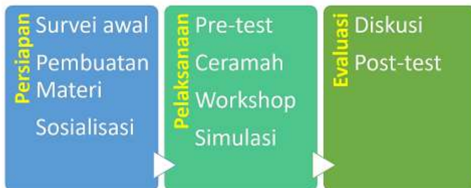
Gambar 2. Alur Pelaksanaan Kegiatan Pelatihan Literasi Keuangan Nelayan

Alur pelaksanaan kegiatan disajikan pada Gambar 2. Kegiatan diawali dengan survei awal pada Desember 2025 untuk mengidentifikasi kondisi literasi keuangan dan kebutuhan pelatihan peserta, dilanjutkan dengan perancangan modul pelatihan yang kontekstual sesuai karakteristik usaha produk hasil laut. Tahap sosialisasi dan rekrutmen melibatkan koordinasi intensif dengan mitra kegiatan. Inti kegiatan adalah pelatihan tiga hari yang mengintegrasikan metode ceramah interaktif, dan workshop praktik langsung yang dilanjutkan dengan Focus Group Discussion (FGD). Tahap akhir adalah evaluasi melalui instrumen pre-test dan post-test serta program pendampingan lanjutan.