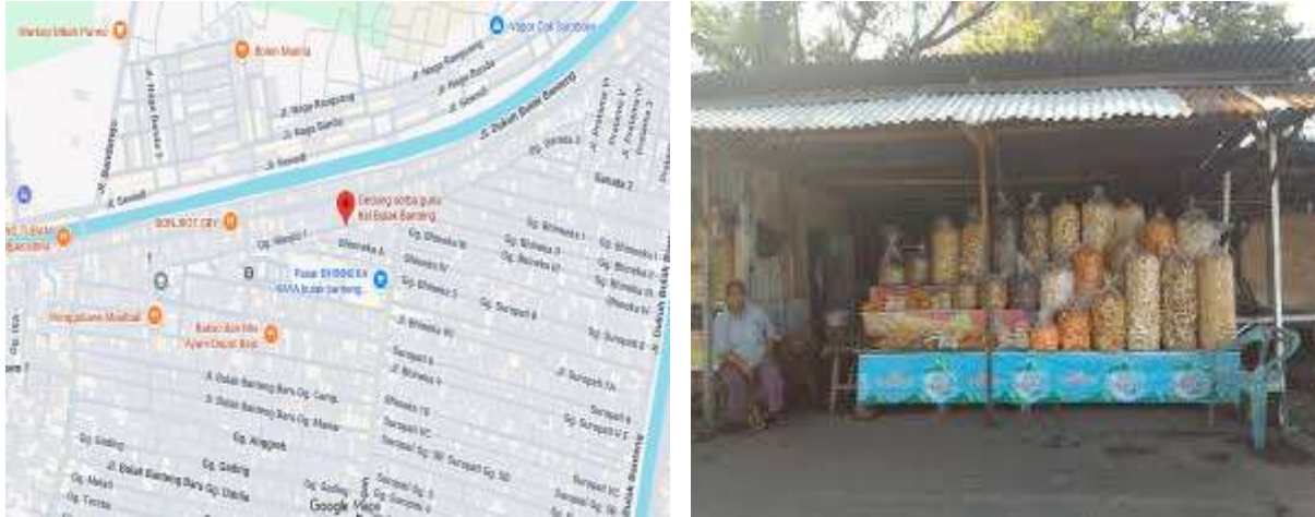
Gambar 1. Peta Lokasi PkM UMKM Hasil Laut dan Produk Hasil Laut