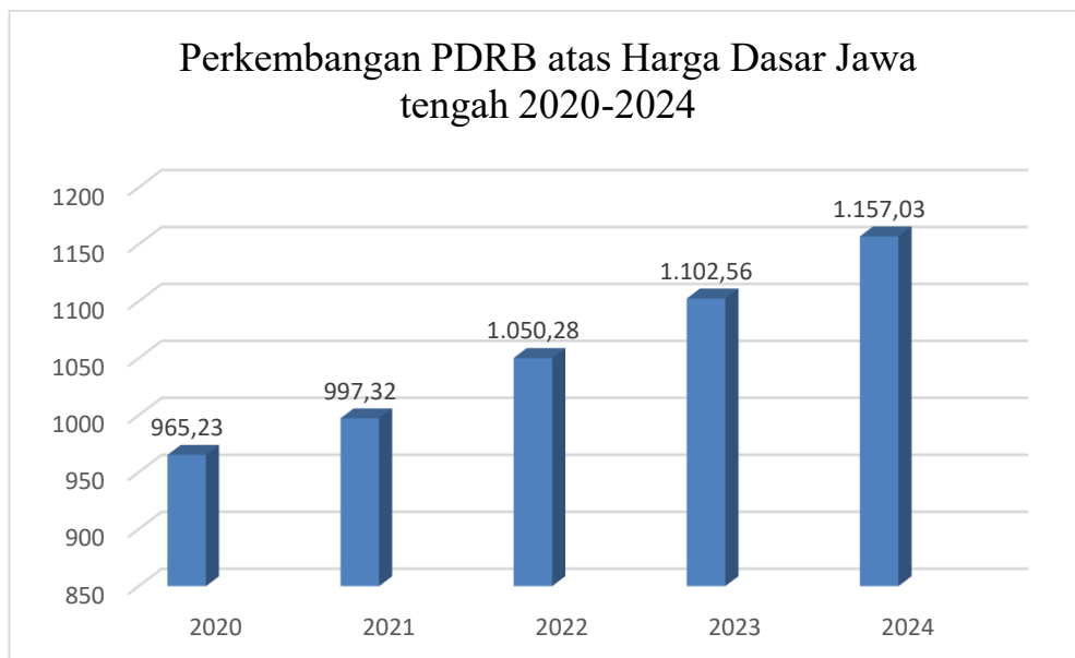
Gambar 2. Data PDRB ADHK Provinsi Jawa Tengah 2020-2024

Perkembangan nilai Produk Domestik Regional Bruto (PDRB) atas dasar harga konstan (ADHK) mencerminkan perubahan output ekonomi riil suatu wilayah yang telah disesuaikan dengan inflasi, sehingga memberikan gambaran yang lebih akurat tentang dinamika ekonomi riil Jawa Tengah dari waktu ke waktu. Berikut disajikan data PDRB ADHK tahun 2020 sampai 2024: